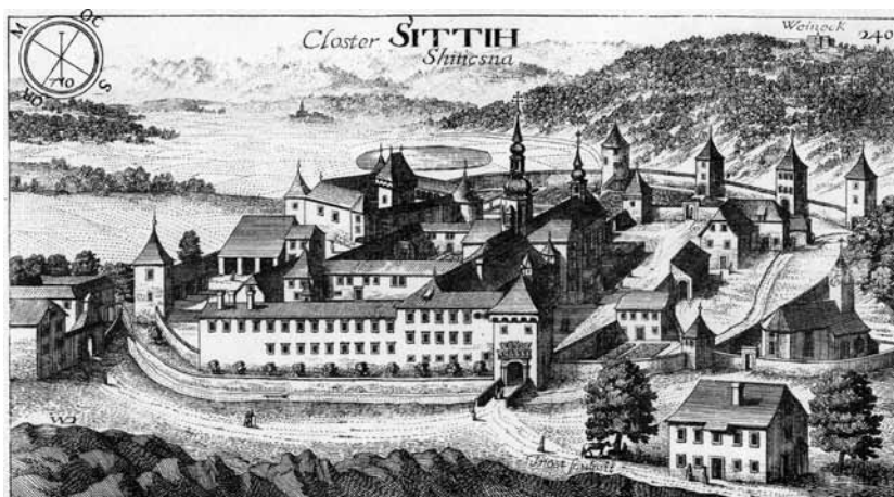
Slika 3: Stiški samostan v drugi polovici 17. stoletja. Bakrorez iz Valvasorjevega albuma Topographia Ducatus Carniolae moderna , Bogenšperk 1679 (faksimile Ljubljana 1995).

novskih gremijih potem šele leta 1514, ko je odobril 100 gld. posojila, 64 1515, ko je nanj odpadlo 200 renskih gld. davka oziroma je bil predviden za pečatenje opolnomočja ( gewalt ) stanovskim odposlancem. 65 Njegov naslednik Urban je novembra 1518 pritisnil pečat na pooblastilo kranjskemu pogajalcu Bernardinu Raunachu. 66