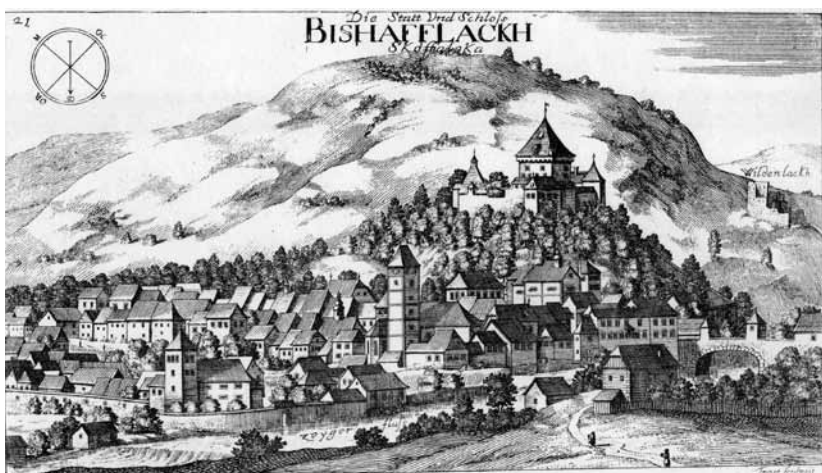
Slika 5: Škofja Loka, center freisinške posesti na Kranjskem. Bakrorez iz Valvasorjevega albuma Topographia Ducatus Carniolae modernae , Bogenšperk 1679 (faksimile Ljubljana 1995)

prav tako ga ni 1590. Na seznamu za leto 1577 sicer je, a s pripisom »zaradi gospostva Loka«, s čimer je bolj kot škofov poudarjen status gospostva. 132